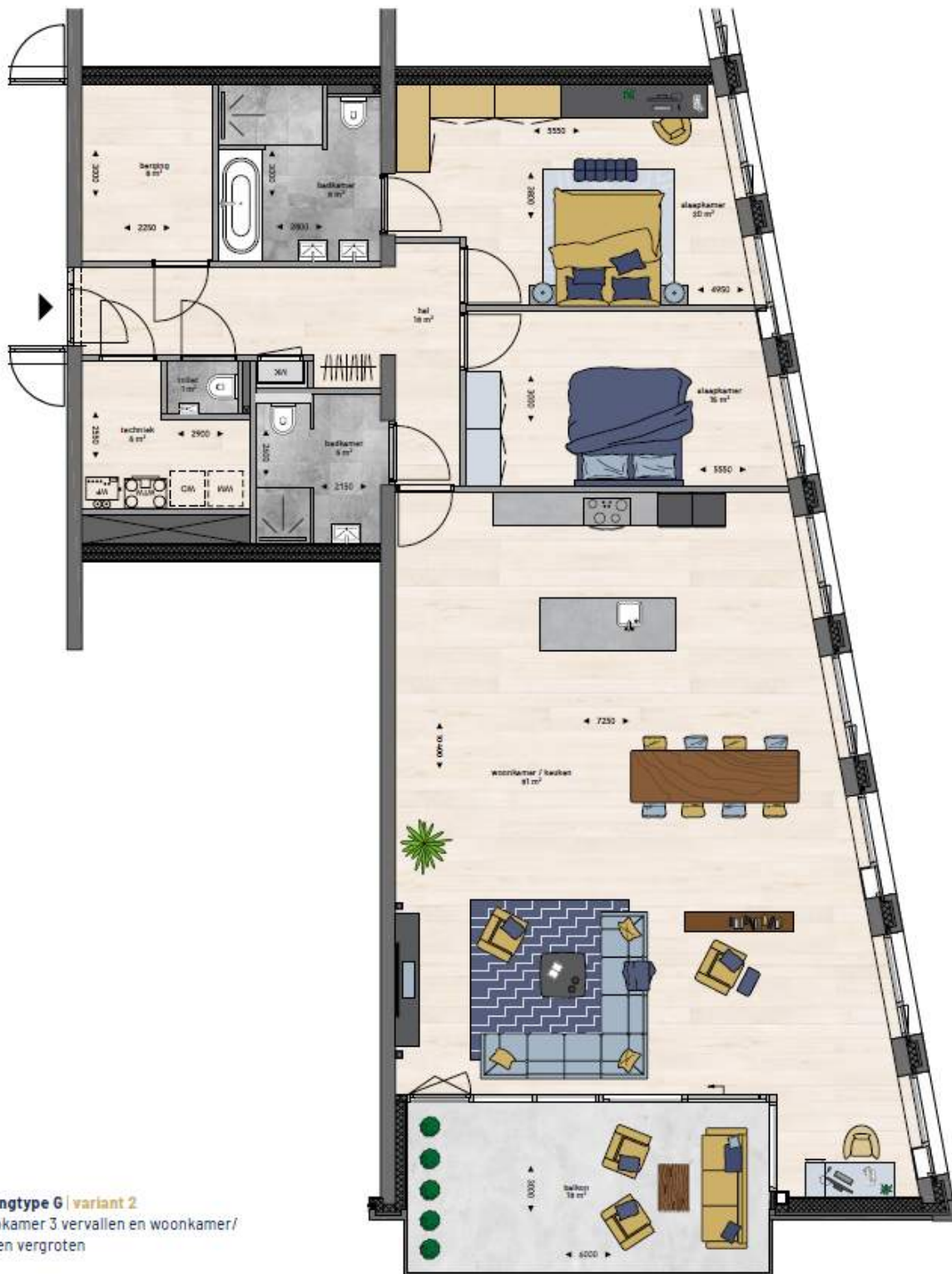
Woningtype G | variant 2 Slaapkamer 3 vervallen en woonkamer/ keuken vergroten